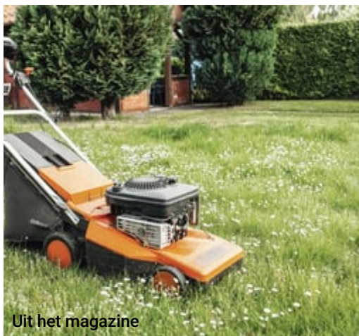
Uit het magazine

( https://www.artsenkrant.com/ak-update-specialist/pneumologie/corticosteroidgeindiceerd-bij-astma/article-71126.html )