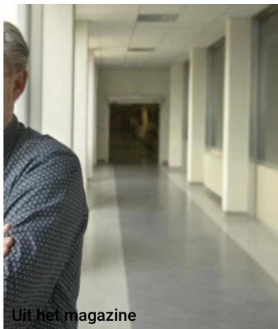
Uit het magazine

( https://www.artsenkrant.com/ak-update-specialist/pneumologie/congres-2024-van-de-ats/groupement-gallery-71726.html )